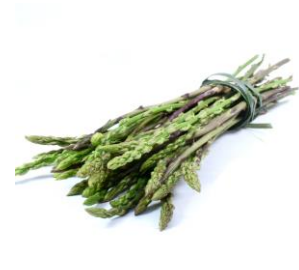
Wilde asperge Portugal