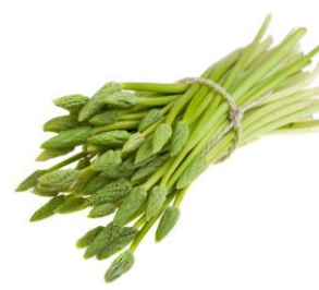
Korenaar asperge Het wat wrange kruidige aroma is zeer geliefd onder chefs 56616