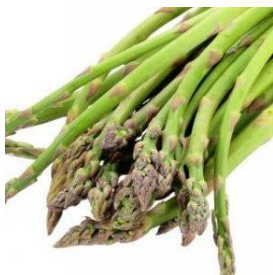
Wilde asp. Albus Wilde asperge uit Spanje. Geconcentreerde smaak met duidelijke bitters 64318