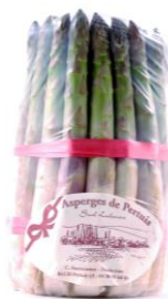
Pertuis asperges Delicatesse uit het Middellands-zeegebied 20 mm 64320 26 mm 64321