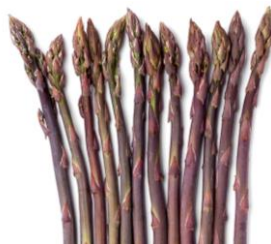
Paarse asperge Zoetere asperge die niet geschild hoeft te worden 57187