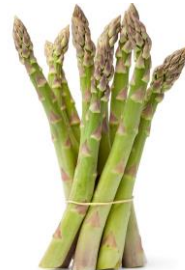
Groene asperge Frankrijk: 57130 Holland: 57117 Import XL: 11223 Tips: 16093