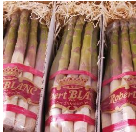
Vertes Villelaure Robert Blanc teelt de beste groene asperges Demoiselles 57154 Filettes 57155