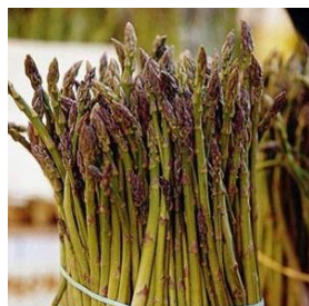
Wilde Maritimus Wilde asperge uit Spanje. Minder bitter en zoetere smaak. Iets paarse kleur 64319